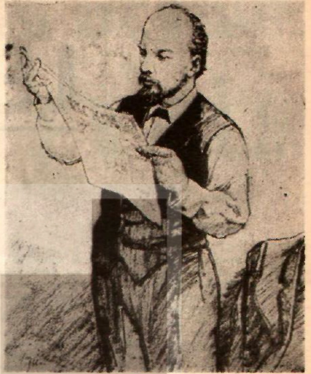
Lenin, İskra'ya İnceliyor.

Yoldaşlarımızın 1898 de yaptıkları kongre, görevlerini doğru tanımladı ve yalnızca başka insanların sözlerini tekrar etmedi yalnızca «entellektüellerin» gayretini ifade etmedi... Parti programı, örgütlenme ve günün koşullarına göre taktikler önerme sorunlarını yerine koyarak, bu görevleri yerine getirmek üzere azimle işe başlıyoruz. Programımızın temel esasları hakkındaki görüşlerimizi zaten ileri sürdük; ve tabii bunların detaylarını geliştirmenin yeri burası değil; gelecek sayılardaki bir kaç seri makaleyi, karşı karşıya olduğumuz